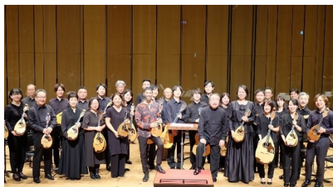
東京プレクトラムオーケストラ