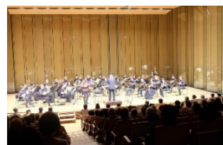
東京プレクトラム オーケストラ